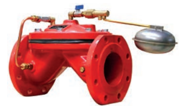
Float Control Valve VLF-D-FLV