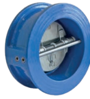
Dual Plate Check Valve VLF-C-800