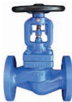
Globe Valve VLF-GU-700