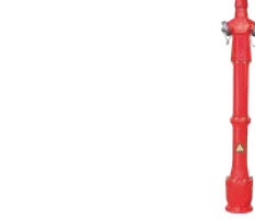
Overground Fire Hydrant VLF-F-1400