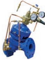
Surge Anticipating Control Valve VLF-Y-SA