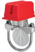
Flow Switch VLF-F-1300