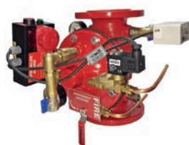
Dry Alarm Valve VLF-F-200