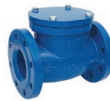
Swing Check Valve VLF-C-300