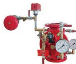
Deluge Valve VLF-F-300