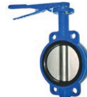
Wafer Butterfly Valve VLF-BV-300