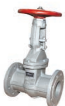
Rising Stem Gate Valve VLF-GU-500