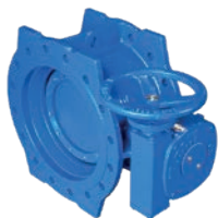
Double Flanged Butterfly Valve VLF-BV-100