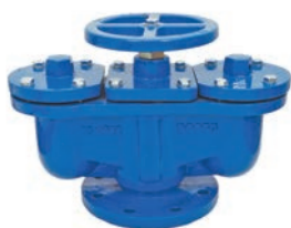
Double Ball Air Valve VLF-AV-100