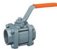
Threaded Ball Valve VLF-KV-400