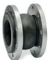
Rubber Expansion Joint VLF-EJ-100