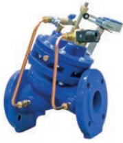
Pump Control Valve VLF-Y-PL