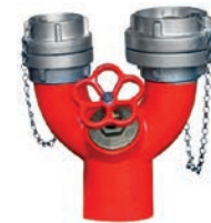
Two Way Inlet VLF-F-1100