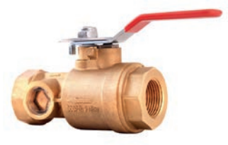
Test Drain Valve VLF-F-800