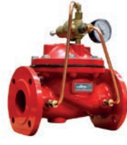
Relief Control Valve VLF-F-600