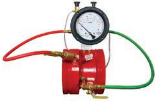
Flow Meter VLF-F-1200