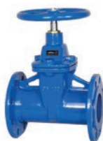
Resilient Seated Gate Valve F5 VLF-GU-200