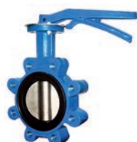
Lug Butterfly Valve VLF-BV-400