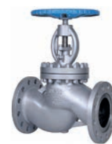
Steel Globe Valve VLF-GU-800