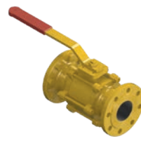
Natural Gas Ball Valve VLF-KV-300