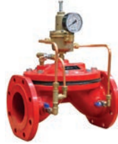
Pressure Sustaining Valve VLF-D-PSV