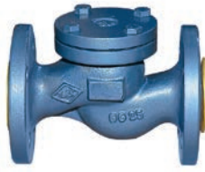
Spring Check Valve VLF-C-400