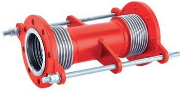
Dilatation Expansion Joint VLF-EJ-400