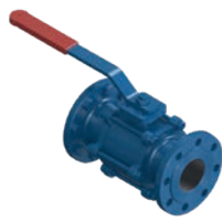
Ball Valve PN 16 VLF-KV-200