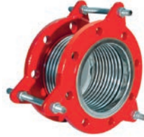
Vibrating Expansion Joint VLF-EJ-500