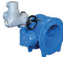
Actuated Butterfly Valve VLF-BV-200