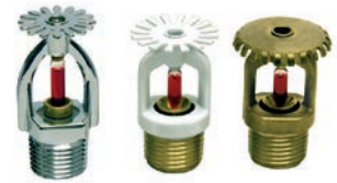
Fire Sprinklers VLF-F-1700