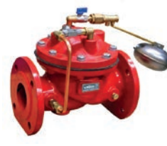
Float Control Valve VLF-F-700