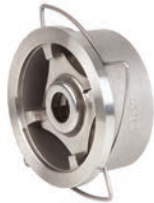
Disc Check Valve VLF-C-700