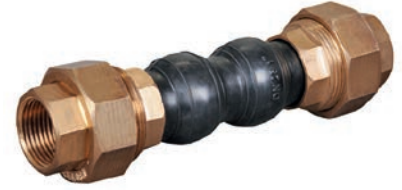
Threaded Rubber Expansion Joint VLF-EJ-600