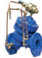
Flow Control Valve VLF-Y-FR