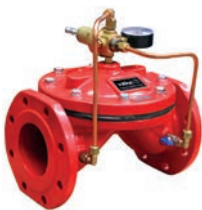
Relief Control Valve VLF-D-QRV