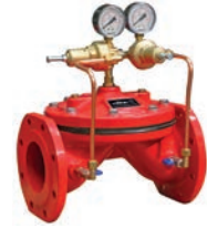
Pressure Reducing & Sustaining Valve VLF-D-PSRV