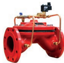
Solenoid Control Valve VLF-D-SCV