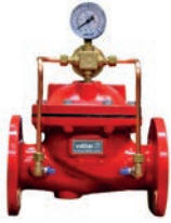
Pressure Reducing Valve VLF-F-500