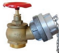
Angle Hose Valve VLF-F-1000