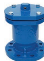
Single Ball Air Valve VLF-AV-300

AISI 304 Stainless Steel · Paslanmaz Çelik