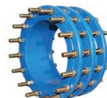
Dismantling Joint VLF-BV-600