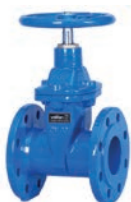
Resilient Seated Gate Valve F4 VLF-GU-100