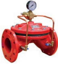
Pressure Reducing Valve VLF-D-PRV