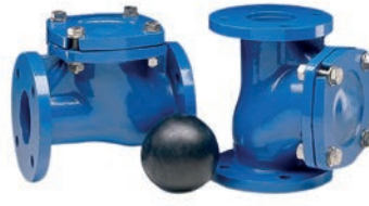
Ball Check Valve VLF-C-500