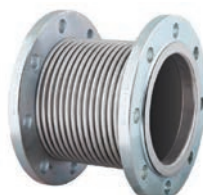
Metal Expansion Joint VLF-EJ-200

ST37 Steel · Çelik - GG25 Cast Iron · Pisk Döküm