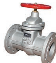
Metal Seated Gate Valve F5 VLF-GU-400