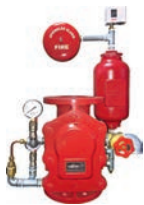
WET ALARM VALVE VLF-F-100