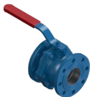
Ball Valve PN 10 VLF-KV-100