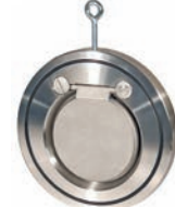
Wafer Check Valve VLF-C-600